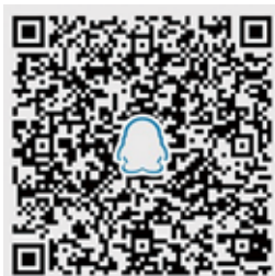
中外联合培养双学位项目转专业QQ咨询群