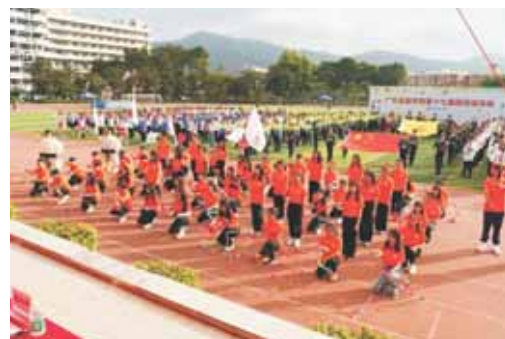
▲ 广东金融学院第十七届田径运动会