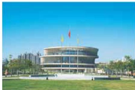
▲具有金融特色的标志性建筑图书馆

第二十二条 我校“2+2”中澳班、“2+2”国际班、“3+X”国际班为中外联合培养专业，在广东省录取时单独设置中外联合培养专业组进行录取，录取规则实行“专业志愿优先”原则，根据考生所填报专业志愿顺序，按考生投档总分排位情况从高到低录取。考生投档总分相同时，按照考生排位择优录取。当考生排位相同时，优先录取修习相关专业基础知识（模块）的考生。