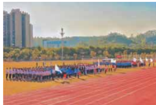
▲ 广金清远校区首届校运会现场