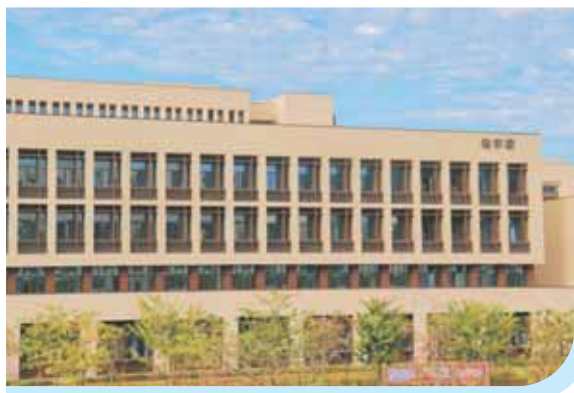
▲ 清远校区拥有中央空调教学楼群