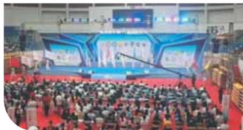
▲ 广金学子参加“挑战杯”大学生创业大赛

就业方向： 本专业毕业生能在企业、事业单位和政府部门从事物流管理、电子商务、企业管理等工作；同时毕业生能从事凸显我校金融特色的物流金融与供应链金融的金融机构的管理工作。