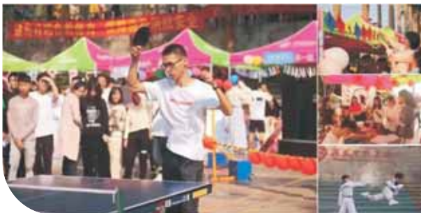
▲ 学生社团活动之百团大战

培养目标： 本专业培养适应社会主义现代化建设需要，具有坚实的经济管理与资产评估的理论基础，熟悉资产评估、金融投资、财务管理、会计审计等相关专业