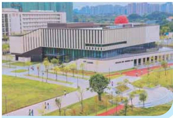
▲ 清远校区学生活动中心会堂

第三十八条 本章程由广东金融学院授权广东金融学院招生与就业工作处解释。本章程若与国家和各省（自治区、直辖市）的规定不一致，以国家和各省（自治区、直辖市）的规定为准。