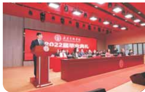
▲ 广东金融学院2022届毕业典礼

劳动关系专业是适应珠三角经济转型和粤港澳大湾区协同发展的需要，建立在经济学、管理学、法学和社会学学科平台基础上的工商管理类交叉应用型学科。我们拥有来自中国人民大学、澳门科技大学、中南财经政法大学等知名高校的教授、博士团队，师资力量强大。是中国人力资源开发协会劳动关系分会的会员单位。教师的科研项目包括主持全国教育科学基金项目一项、教育部人文社会科学项目三项、广东省哲学社会科学项目三项等，近三年在SSCI、CSSCI等国内外核心期刊发表学术期刊二十余篇。每年指导学生参加国家和省级大学生创新创业项目，获得奖项。