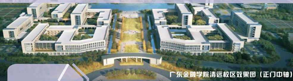
广东金融学院清远校区效果图（正门中轴）