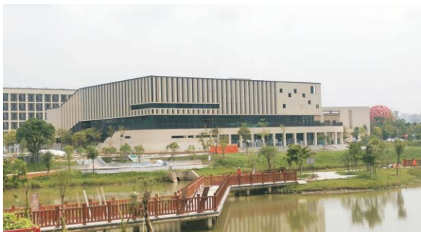
▲风景怡人的清远校区南区食堂

就业方向： 本专业毕业生主要在工商企业、金融企业、事业单位、各级政府部门及会计师事务所等，从事财务管理、管理会计及相关经济管理工作，是国家目前急需的专业技术人才，也可继续深造，在学校和科研单位攻读会计及相关学科的硕士。