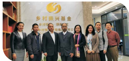
▲工商管理学院与广州乡村振兴控股集团签署战略合作协议

就业方向： 本专业毕业生能在企业、事业单位和政府部门从事物流管理、电子商务、企业管理等工作；同时毕业生能从事凸显我校金融特色的物流金融与供应链金融的金融机构的管理工作。