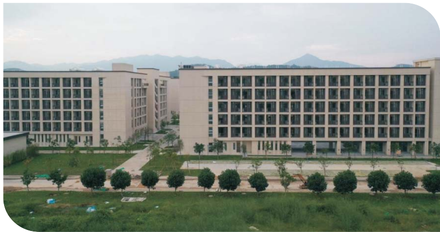
▲ 清远校区设备齐全、舒适温馨的学生宿舍楼群

就业方向： 本专业毕业生能在中外资保险、银行、证券等金融机构、政府部门和企事业单位从事金融风险管理、精算、数据分析、保险等相关专业工作。