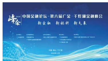
▲ 我校举办中国金融论坛 — 第六届广金·千灯湖金融峰会

培养目标： 本专业旨在培养学生成为经济和财税理论基础扎实，了解国家制度与公共政策制订，熟悉财政税收体制与管理，精通企业财税业务与技能，有独立思考能力和习惯、富有创新精神的应用型人才。