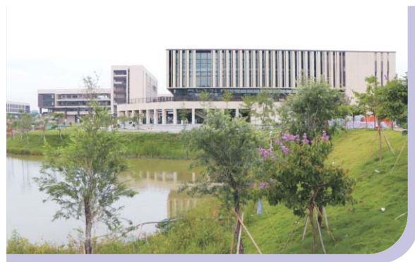
▲ 清远校区学生活动中心会堂

第三十八条 本章程由广东金融学院授权广东金融学院招生与就业工作处解释。本章程若与国家和各省(自治区、直辖市)的规定不一致, 以国家和各省(自治区、直辖市)的规定为准。