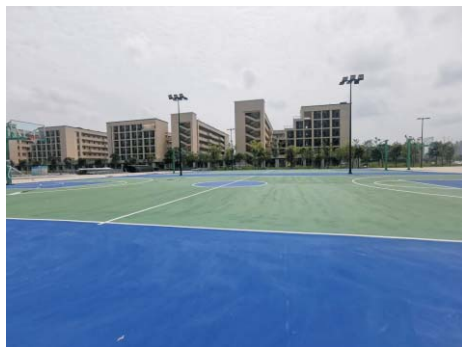
▲清远校区宽阔的运动场

从我国专业社会工作人才队伍建设的总体情况看，据《中国社会工作发展报告》的数据显示：我国专业社会工作人才已达30万人，距2020年300万的宏观目标仍差距明显。在这样的政策背景和社会服务发展形势下，全国尤其是广东社会工作行业快速发展。至2013年底，广东社工机构数量约400家，占全国总数的32%；持证社工人数达到2万人以上，广东社工机构及社工人数增速为全国其他地区的5到8倍。尽管如此，社会工作专业人才的数量和增长还远远达不到目标，根据测算，仅广东的社工人口缺口就达3万人，社会需求尤其强烈。广东金融学院在整合相关专业师资力量基础上，新开设社会工作本科专业，面向华南地区和粤港澳大湾区，为加强社会治理体系建设，提高社会治理水平，培养高素质的社会管理及社会服务人才以及“专业型”人才，提升社会工作从业者在具体实务领域上需要具备的专项技能打下坚实的基础。