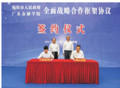
▲ 我校与揭阳市人民政府签订战略合作协议

主要课程： 通识必修课：高等数学、西方经济学、社会学等。学科基础课：普通心理学、生理心理学、心理测量学、心理统计学、实验心理学、认知心理学等。专业必修课：人格心理学、社会心理学、发展心理学、管理心理学、心理咨询、变