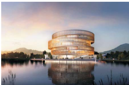
▲具有金融特色的标志性建筑图书馆（效果图）将于8月31日交付

第二十二条 我校“2+2”中澳班、“2+2”国际班、“3+X”国际班为中外联合培养专业，在广东省录取时单独设置中外合作办学专业组进行录取，录取规则实行“专业志愿优先”原则，根据考生所填报专业志愿顺序，按考生投档总分排位情况从高到低录取。考生投档总分相同时，按照考生排位择优录取。当考生排位相同时，优先录取修习相关专业基础知识（模块）的考生。