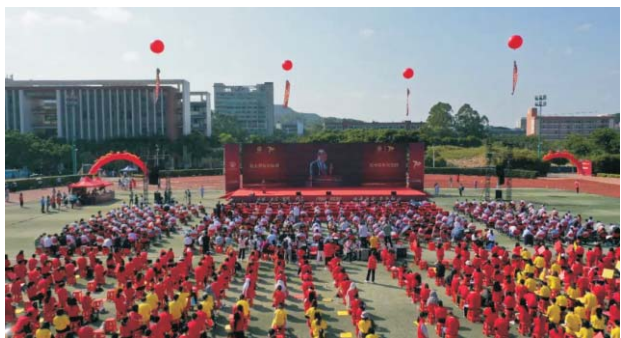
▲ 广东金融学院庆祝建校70周年大会隆重举行

就业方向： 本专业毕业生适合在银行、证券与期货公司、基金管理公司、资产管理公司、保险公司等各类金融机构以及金融局、金融科技公司等，从事数字化转型、金融科技开发与管理等方面的工作。