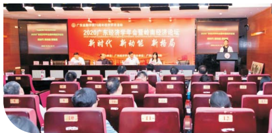
▲ 2020广东经济学年会暨岭南经济论坛在我校召开

培养目标： 本专业培养适应社会主义现代化建设需要，具有坚实的经济管理与资产评估的理论基础，熟悉资产评估、金融投资、财务管理、会计审计等相关专业知识，掌握现代资