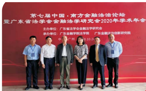
▲ 第七届中国·南方金融法治论坛在我校召开

就业方向： 本专业毕业生，主要到企事业单位、行政机关、司法机关、律师事务所、知识产权公司及行业协会等单位从事法律和知识产权管理工作。