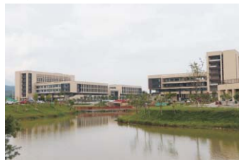
▲清远校区设备完善的实验楼群