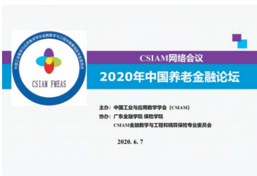
▲ 我校保险学院举办“CSIAM 2020中国养老金融论坛”