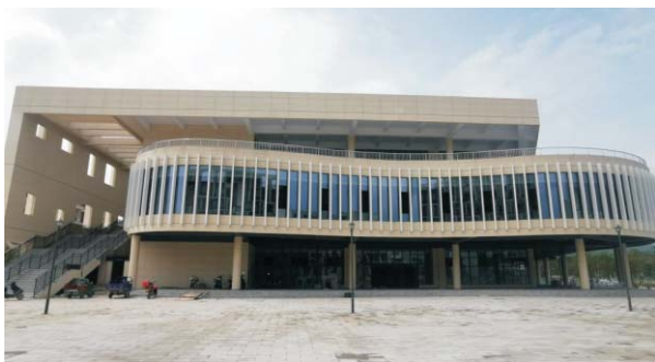
▲温馨的清远校区北区食堂