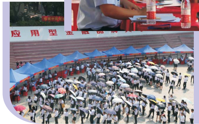
▲ 我校举办中国建设银行广东省分行2021年度校园招聘见面会