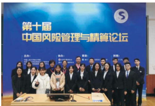
▲ 我校保险学院师生参加第十届中国风险管理与精算论坛

就业方向： 本专业毕业生能在保险、银行和证券等金融机构、金融监管等政府部门和其它企事业单位从事保险、风险管理与精算、投资管理、企划规划、数据分析等相关专业岗位工作。