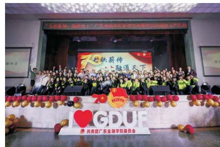
▲ “七秩薪传，融通天下” ——我校举行建校70周年暨2020迎新文艺汇演

就业方向： 本专业毕业生可进入各级政府部门、企事业单位、金融机构的人力资源管理、劳动关系岗、公共关系岗工作。进入市、区级和乡镇工会组织，从事劳动关系协调员、职业化工会干部、工会协理员等职业；亦可担任劳动执法监察员、劳动争议仲裁员及劳动司法机构的其他工作人员；外包公司、猎头公司的管理、培训、咨询人员；街道及社区的劳动争议调解员等。在校时可以考取的证书包括“人力资源管理师资格证”，“劳动关系协调师资格证”等。近年还有一批学生通过考研进入了中国人民大学、中南财经政法大学等985、211高校的本专业深造。